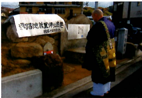
誓重寺住職による法要

これひとえに整備して頂いた(株)門屋組様のご協力によるものと、心より御礼申し上げます。