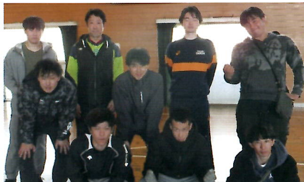
▲接戦の末、連覇を逃した男子チーム