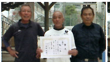
▲準優勝の鴨川Cチーム