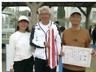
▲優勝した鴨川団地チーム