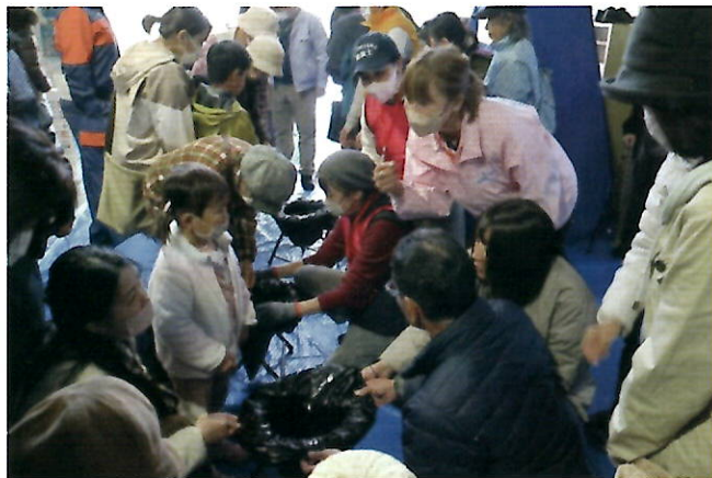
▲椅子に黒い袋を被せて作る簡易トイレ設置訓練

令和6年度潮見地区合同防災訓練が11月24日（日）、潮見小学校体育館で開催され、一般参加者約180人のほか、潮見地区自主防災連合会や女性防火クラブ、防災士、消防団、民生児童委員、社会福祉協議会、日赤奉仕団など約80人が参加。トイレ対策や避難者用テント設営収納、応急給水栓使用などについて動画を見たり、実際に体験したりして真剣に学んでいました。