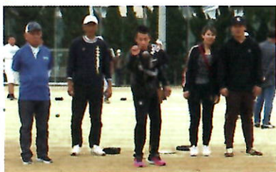
▲標的のピュットを狙って金属のボールを投げる参加者