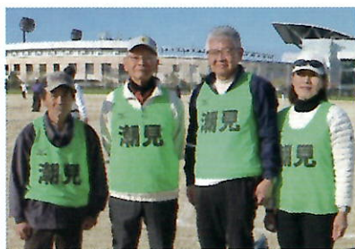
▲地区ペタンク大会の優勝メンバーで構成された潮見公民館チーム