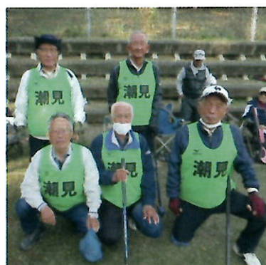
▲潮見公民館チーム

愛媛スポレク祭2024 グラウンド・ゴルフ大会が11月3日(日)愛媛県総合運動公園で開催され、松山市民グラウンド・ゴルフ大会(6月30日)で12位だったメンバーが出場しました。