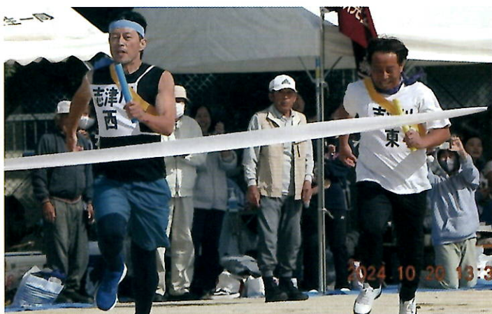
▲男子年齢別リレー決勝で2年連続新記録の西志津川チームの選手（左）