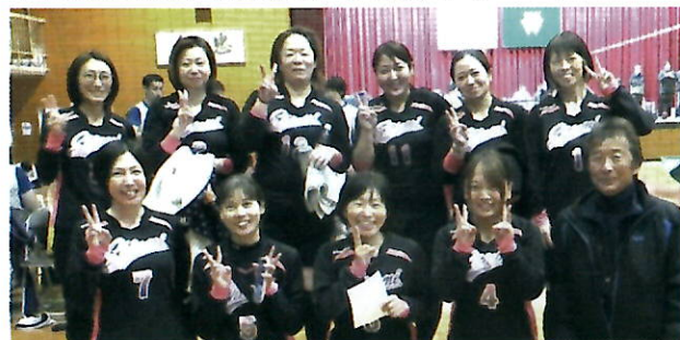
▲奮闘かなわず1勝が遠かった女子チーム

令和6年度第7ブロック公民館親睦バレーボール大会が11月24日(日)、内宮中学校体育館で開催され、潮見公民館チームは男子が第三位、女子は第四位でした。