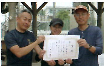
▲第三位のチーム谷町B

令和6年度潮見地区ペタンク大会が11月17日(日)、潮見小学校グラウンドで開催され、24チーム72人が参加。初心者が熟練者から投げるコツを教わったり、練習の成果を発揮して一発逆転を狙ったりするなど、子どもから高齢者まで、だれでもすぐに取り組めるペタンクで交流を深めていました。