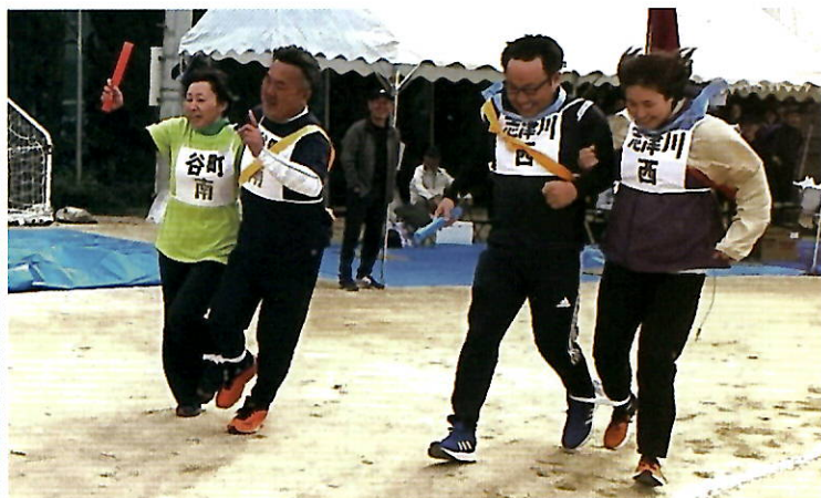
▲アベックリレーで息の合った走りをする選手たち