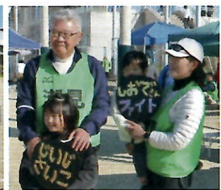
▲選手のお孫さんたちが手作りのうちわを持って応援

第23回松山市民ペタンク大会が12月1日(日)、松山中央公園運動広場で開催され、地区ペタンク大会で優勝した鴨川団地チームが出場。まさかの逆転負けを喫し予選リーグで敗退しましたが、選手のかわいいお孫さんたちが手作りのうちわを持って応援に駆けつけ、テレビの取材を受けていました。