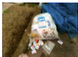
※プラマークのないプラ製品や紙類が混入