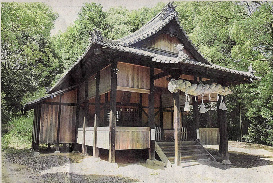
日本政府観光局パリ事務所のインスタグラムで紹介された天満神社

松山市谷町の天満神社が、日本政府観光局（JNTO）パリ事務所のインスタグラムで紹介されている。平安時代に創建した歴史ある神社だが、これまで観光とは無縁だった。地元住民は喜びの一方で「なぜ？」と驚きの声も上げている。