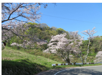
吉藤池下の市道沿い (4月1日撮影)