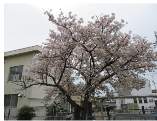
松山市潮見支所 (3月27日撮影)