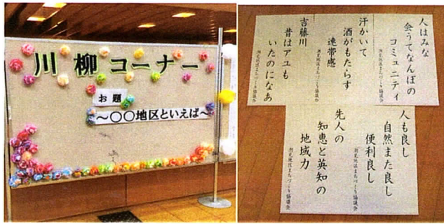
川柳展示コーナー(潮見応募作品)