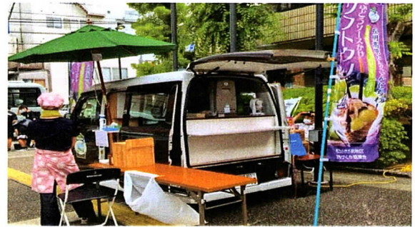
五明地区まち協キッチンカー